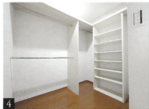
Walk-in closet / 1F