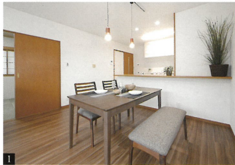
Living / Dining

キッチン・バス・トイレ・洗面入替、カップボード新設、全室クロス貼替、CF貼替、壁・天井貼替 窓交換、コーティング仕上げ、外壁・屋根塗装、ウッドデッキ新設、エクステリア整備