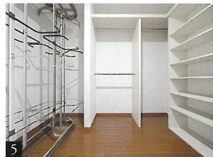
Walk-in closet / 2F