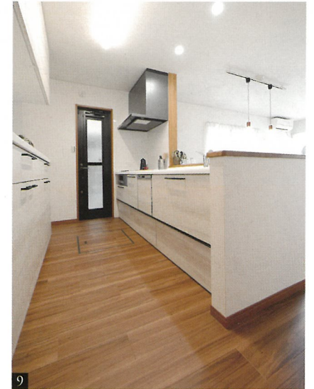
Kitchen & Back stock